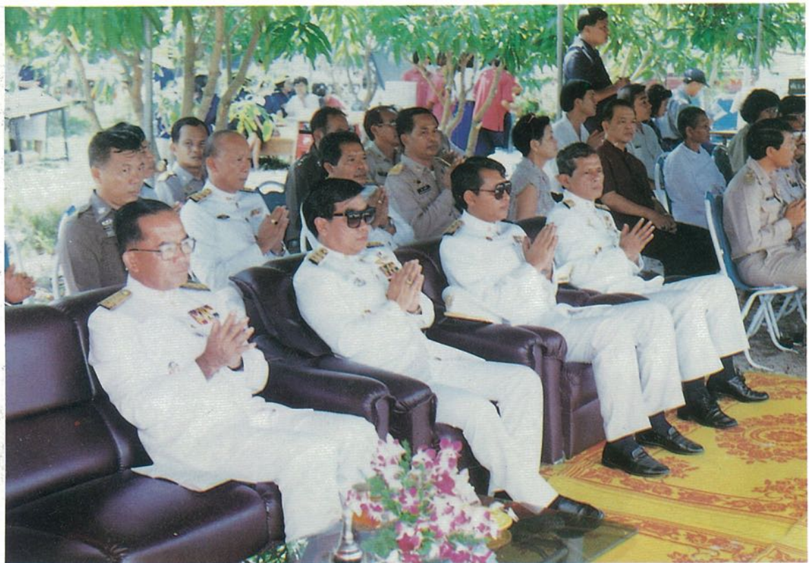
๓๒ ที่ระลึกพิธีเปิดห้องสมุดประชาชน "เฉลิมราชกุมารี"