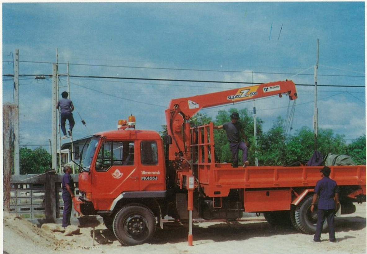
๓๘ ที่ระดักรพธัเบ็ดท่๑งสมุเดประชาชน "เฉลิมราชกุมารี"