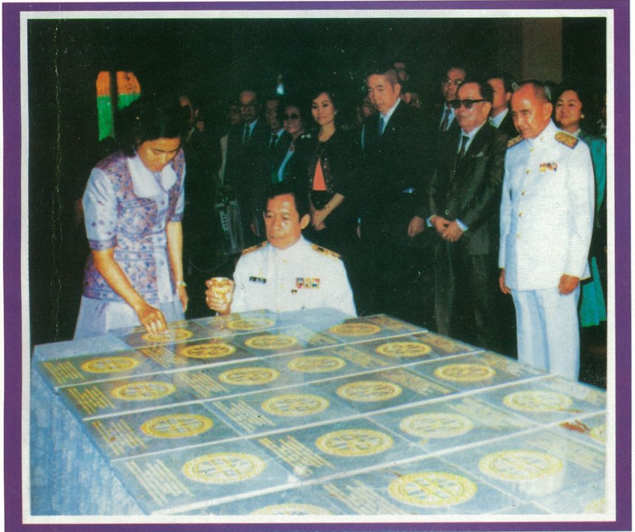
ดร.ก้อง สวัสดิ์พีลาณิชย์ รัฐมนตรีว่าการกระทรวงศึกษาธิการ นำคณะกรรมการ อำนวยการฯ ผู้ว่าราชการจังหวัด ผู้ให้การสนับสนุนและร่วมโครงการ จัดตั้งห้องสมุดประชาชน "เฉลิมราชกุมารี" เพื่อทรงสุหรัาย ทรงเจิม และรับพระราชทานของที่ระลึก ณ ศาลาศิวลาลัย สวนจิตรลดา วันพุธที่ ๑๐ เมษายน ๒๕๓๔