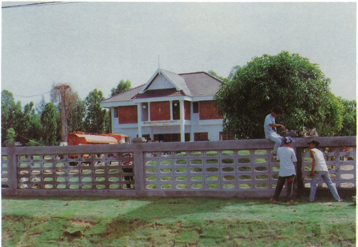
๔๐ ที่ระลึกพิธีเปิดห้องสมุดประชาชน "เฉลิมราชกุมารี"