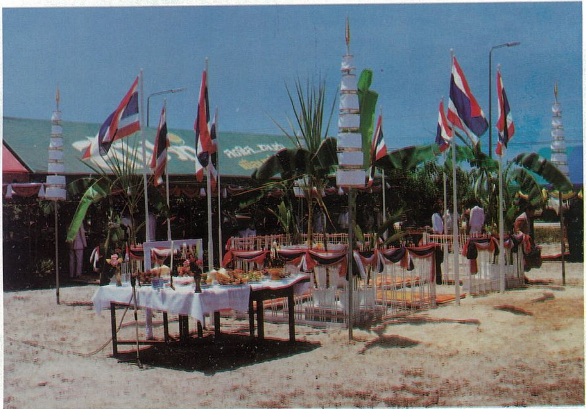
๓๐ ที่ระดัฎพธัเปิดห้องสมุดประชาชน "เฉลิมราชกุมารี"