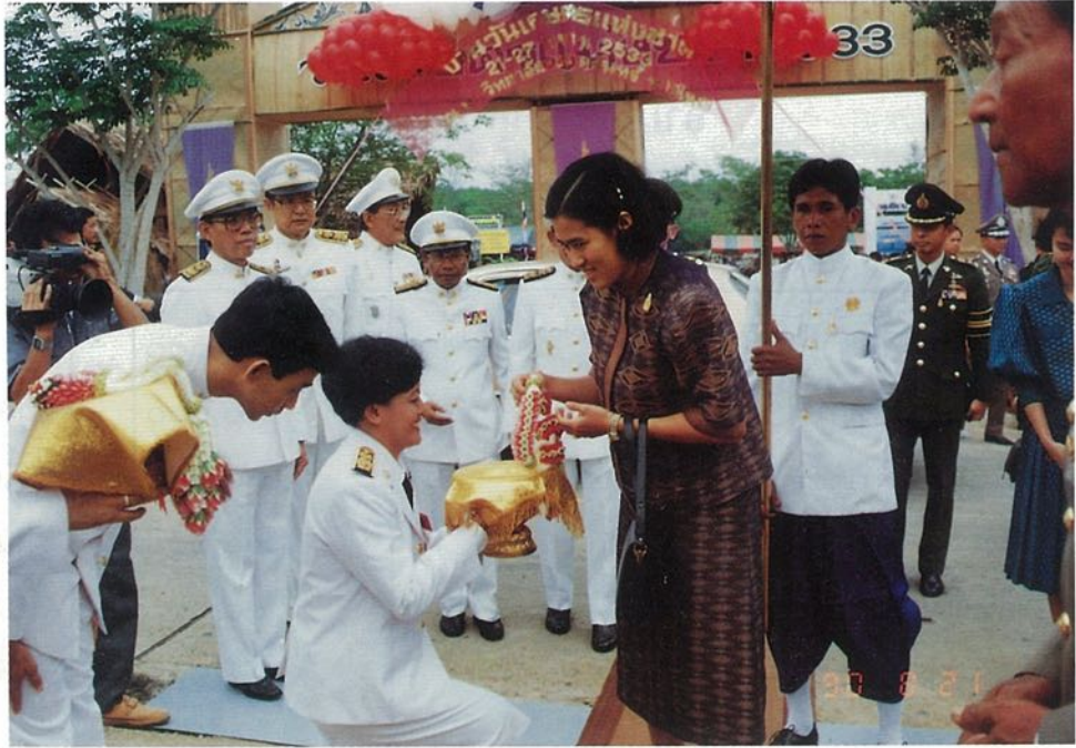
เสด็จพระราชดำเนิน งานวันเกษตรแห่งชาติ ปี ๒๕๓๓ ณ มหาวิทยาลัย สงขลานครินทร์