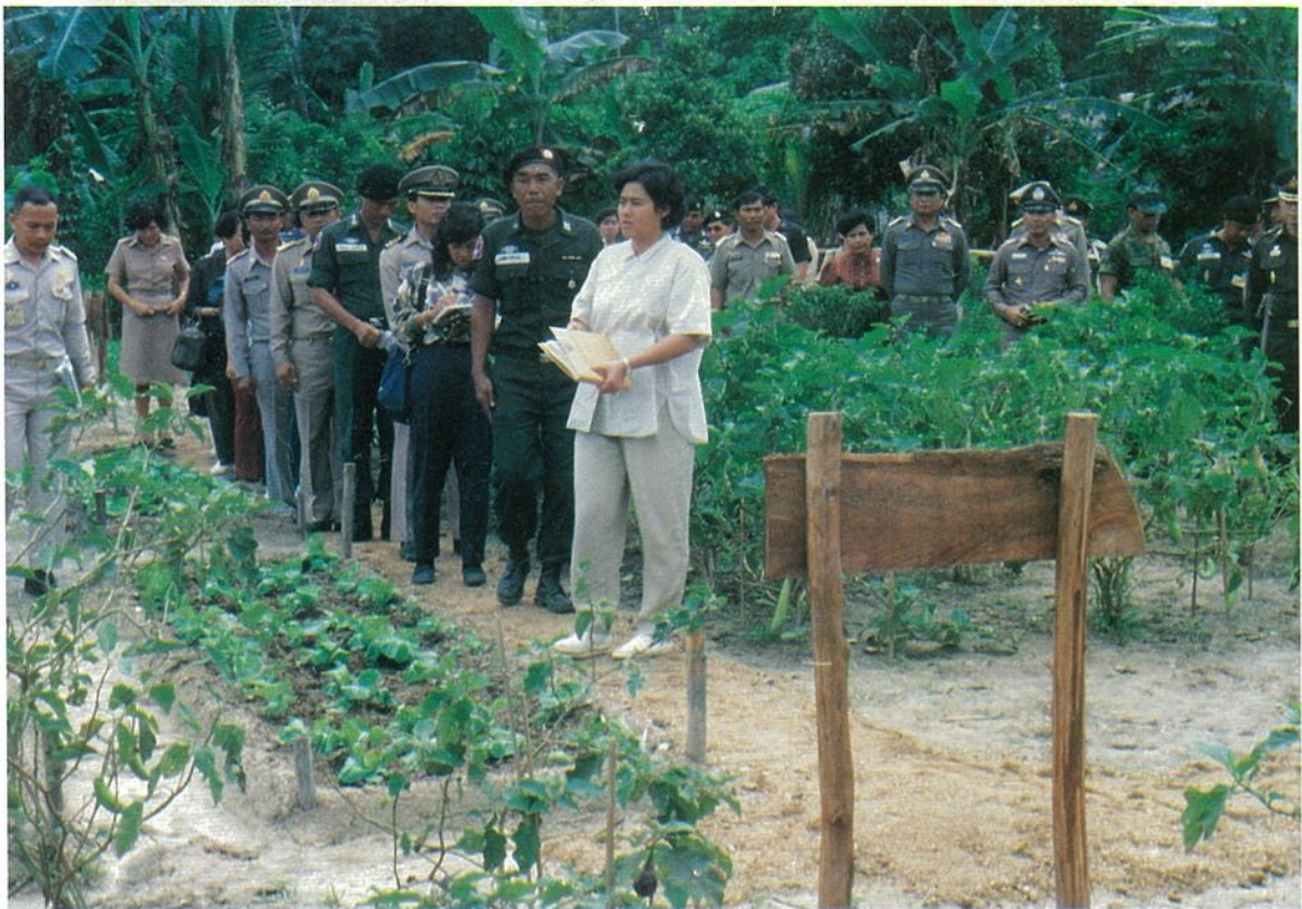
๕๒ ที่ระลึกพิธีเปิดห้องสมุดประชาชน "เฉลิมราชกุมารี"