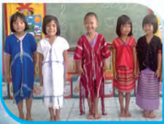
การแต่งกายให้เรียบร้อยตามวัฒนธรรมชนเผ่า