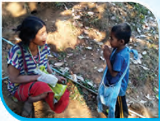
การไหว้ผู้ปกครองก่อนมาโรงเรียน

ผลการดำเนินงานเด็กและเยาวชน ศศช.บ้านผาอันใต้ จำนวนทั้งหมด ๒๐ คน มีความรู้ และสามารถปฏิบัติตามแบบมารยาทไทยได้อย่างเหมาะสมและถูกต้อง รวมทั้งเห็นคุณค่า ในการปฏิบัติตามมารยาทที่ดี มีส่วนร่วมในการอนุรักษ์สืบทอดศิลปวัฒนธรรม