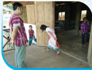
การเดินผ่านหน้าผู้ใหญ่