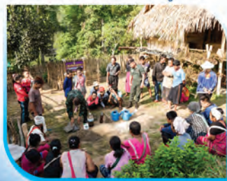
ภาพกิจกรรมใช้อินทรีย์วัตถุในการปรับปรุงดินและลดการใช้สารเคมี