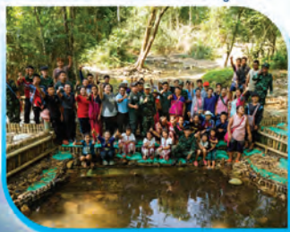
ภาพกิจกรรมสร้างฝายชะลอน้ำ