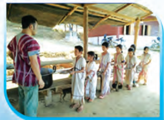
การฝึกระเบียบวินัยในการเข้าแถว