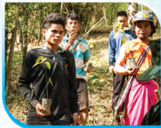
ภาพกิจกรรมการปลูกป่า