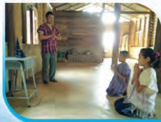
การกราบพระ