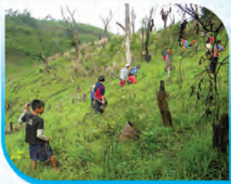
ภาพกิจกรรมการปลูกป่า

ผลจากการดำเนินกิจกรรม บ้านนุกะโละวามีฝายชะลอน้ำความชุ่มชื้นเพิ่มขึ้นมากกว่า ๑๐ แห่ง พื้นที่ป่าที่ทรุดโทรม มีการร่วมมือจัดกิจกรรมการปลูกต้นไม้เพิ่มขึ้นโดยชาวบ้าน ภาคีเครือข่ายอื่น ๆ เกิดความร่วมมือ ข้อตกลงระหว่างเจ้าหน้าที่ ครู และชาวบ้านในการที่จะอนุรักษ์ป่า โดยเฉพาะฝืนป่าต้นน้ำที่มีมาตรการทางสังคมและกฎหมาย ในการจัดการกับผู้บุกรุก ลักลอบตัดไม้ เป็นต้น