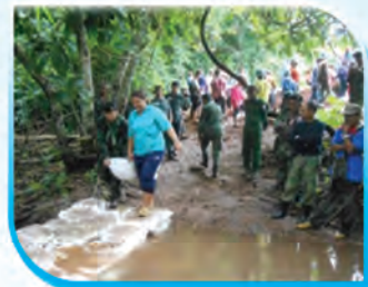
ภาพกิจกรรมสร้างฝายชะลอน้ำ