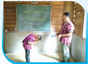
การไหว้ขอบคุณเมื่อได้รับของ