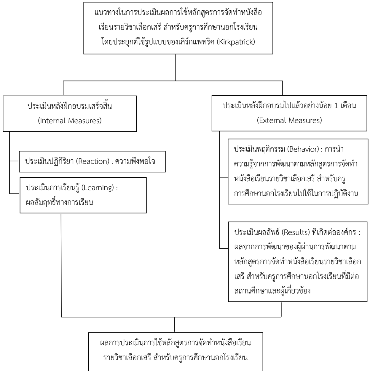
แผนภาพที่ 2 กรอบแนวคิดที่ใช้ในการประเมินผลการใช้หลักสูตร