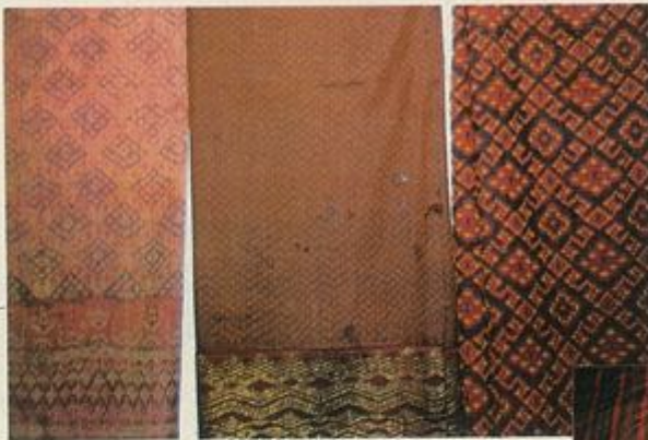
เปรียบเทียบไหมมัดหมี่ ไทย ลาว เขมร