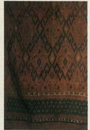
ผ้ารุ่งนาค