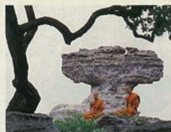
ป่าหินงาม

อำเภอคอนสวรรค์ บึงวาง มีนกเป็ดน้ำกว่า ๔๐,๐๐๐ ตัว พระพุทธรูปหินทรายแกะสลัก หลวงพ่อใหญ่ และพระธาตุหนองสามหมื่นส่วนเขตอำเภอคอนสารมี เขื่อนจุฬาภรณ์ ทอดตัวกั้นลำน้ำพรมระหว่างขุนเขาเพื่อการผลิตกระแสไฟฟ้า และยังเป็นที่ตั้งที่ทำการของเขตรักษาพันธุ์สัตว์ป่าภูเขียว และในเขตอำเภอเกษตรสมบูรณ์ มีเขื่อนห้วยกุ่มสำหรับเก็บกักน้ำเพื่อการเกษตร