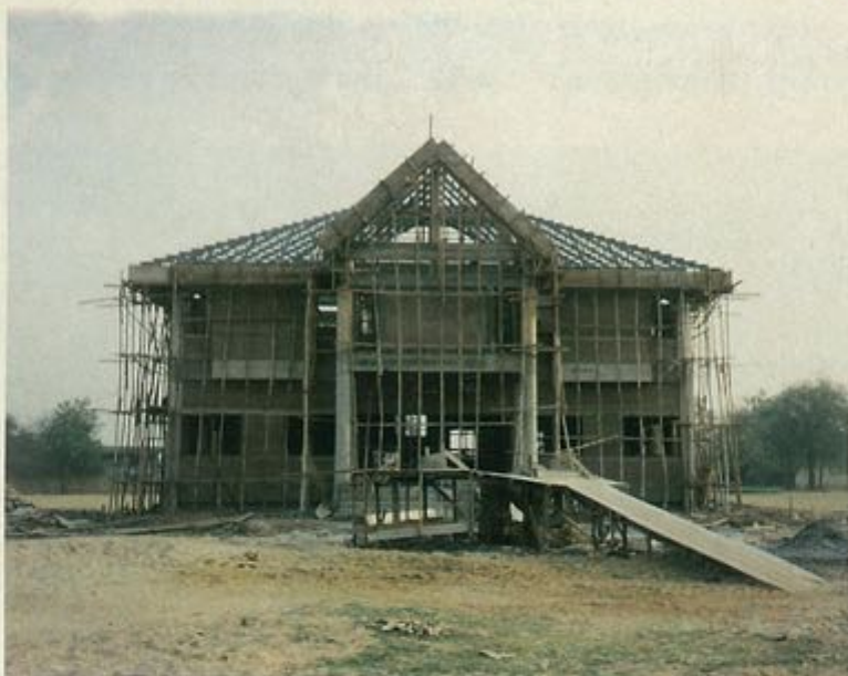
การดำเนินการก่อสร้างห้องสมุดประชาชน "เฉลิมราชกุมารี" อำเภอจัตุรัส จังหวัดชัยภูมิ