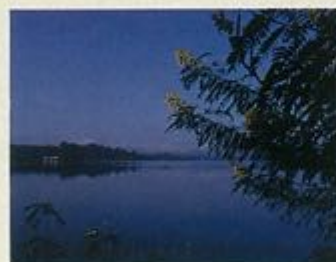
เขื่อนจุฬาภรณ์

เขตอำเภอหนองบัวแดง มีถ้ำสวยงาม ตั้งแต่ถ้ำดิน ถ้ำพระ ถ้ำวัวแดง ถ้ำแก้ว ถ้ำลูกกรง และหน่วยพิทักษ์สัตว์ป่าลาดนกเง่า ผาแก้ง ส่วนในเขตอำเภอเทพสถิตมีป่าหินงามทุ่ง