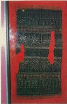
ผ้าห่อพระคัมภีร์ อายุกว่าร้อยปี