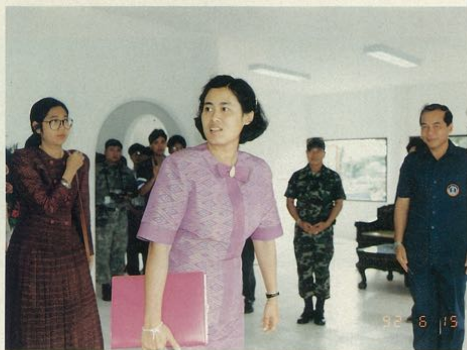
ทรงพักผ่อนพระอริยบทที่ห้องสมุดประชาชน "เฉลิมราชกุมารี" อำเภอจตุรัส จังหวัดชัยภูมิ เมื่อวันที่ ๑๕ มิถุนายน ๒๕๓๕