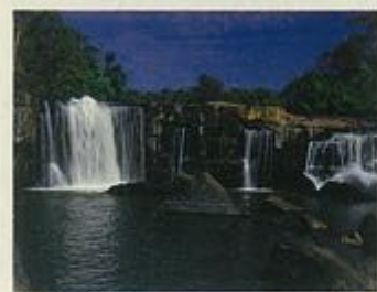
น้ำตกตาดโตน

ชัยภูมิมีแหล่งท่องเที่ยวที่สวยงามด้วยทัศนียภาพของป่าเขา น้ำตก ถ้ำและสวนหิน คับคั่งด้วยแหล่งโบราณสถานที่น่าสนใจควรแก่การศึกษา คณะรัฐมนตรีได้มีมติให้จังหวัดชัยภูมิเป็นเมืองท่องเที่ยวเมื่อวันที่ ๑๑ กันยายน ๒๕๒๗ โดยมีแหล่งท่องเที่ยวที่น่าสนใจ ดังนี้