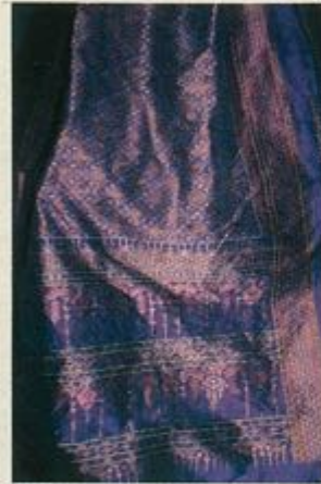
ผ้าปูม ทอลอกแบบลายผ้าชนะ เลิศปี 2535