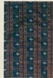
จีนทิวมุก มัดหมี่

ผ้าไหม ผ้าไหมเป็นของคู่กับคนอีสานเกือบเรียกว่า ผ้าไหมเป็นวัฒนธรรมของคนอีสาน เพราะคนอีสานใช้ผ้าไหมแต่งกายตั้งแต่ชาวบ้านจนถึงคนชั้นสูง ผ้าไหมมีมาตั้งแต่สมัยอาณาจักรเจนละ แต่ก็ไม่มีหลักฐานยืนยันได้ว่าการทำกันมาอย่างต่อเนื่องหรือไม่ ที่น่าสังเกตบริเวณรอยต่อ ๓ประเทศ ได้แก่