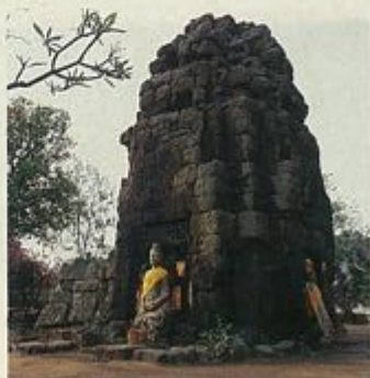
ปราสาทภู

เขตอำเภอเมือง มีแหล่งท่องเที่ยว ทั้งส่วนที่เป็นประวัติศาสตร์และโบราณสถาน นับแต่อนุสาวรีย์เจ้าพ่อพระยาแล ปราสาทภูหนองปลาเฒ่า ภูพระ สระหงษ์ ภูแฝก ภูเสมาทินทราย ยุคทวารวดีที่บ้านกุดโง้ง และรมณีสถาน เช่น อุทยานแห่งชาติตาดโตน น้ำตกผาเอียงและตาดฟ้า