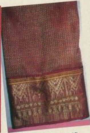
ผ้าจีนซิดไหมคำทอลอกลาย ผ้าห่อพระคัมภีร์