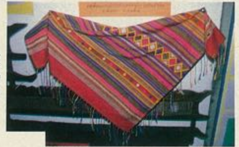
ผ้าปกหัว