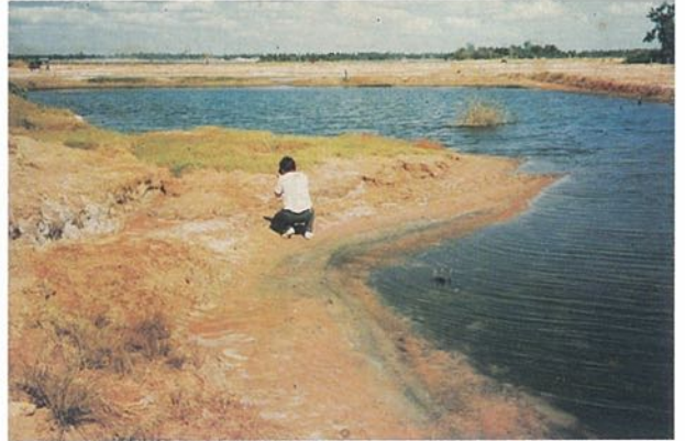
(๒) ลักษณะสภาพพื้นที่ของดินเค็ม