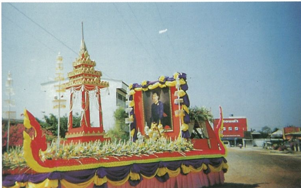
ขบวนแห่แผ่นศิลาฤกษ์