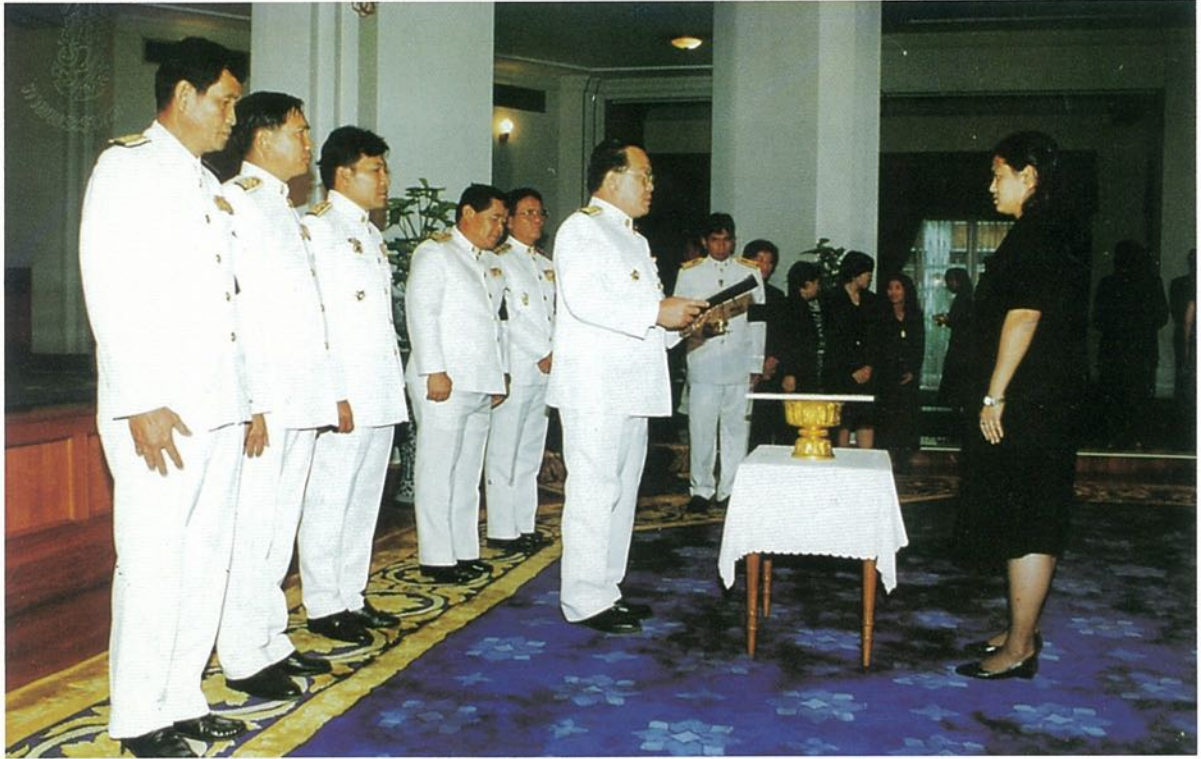
สมเด็จพระเทพรัตนราชสุดาฯ สยามบรมราชกุมารี ทรงพระราชทานแผ่นศิลาฤกษ์ห้องสมุดประชาชนอำเภอกรบือ โดยผู้ว่าราชการจังหวัดมหาสารคามเป็นผู้รับพระราชทาน