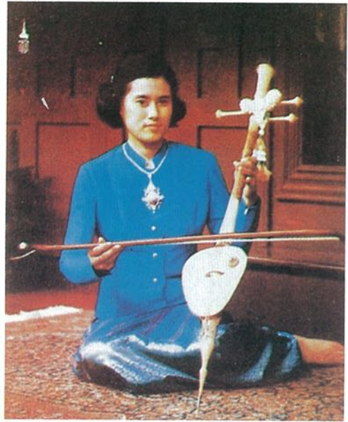
เจ็ดแจรงพระอัจนริยะ