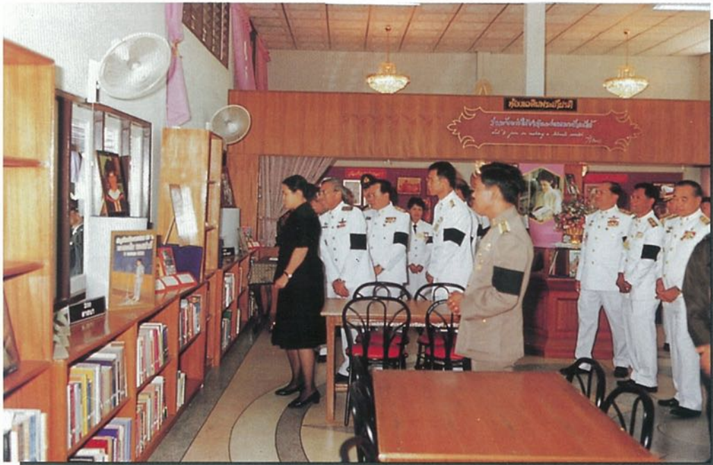
สมเด็จพระเทพฯ เสด็จเป็นองค์ประธานพิธีเปิดห้องสมุดประชาชน “หลวงปู่ศุรียมหารีโร” อำเภอวาปีปทุม