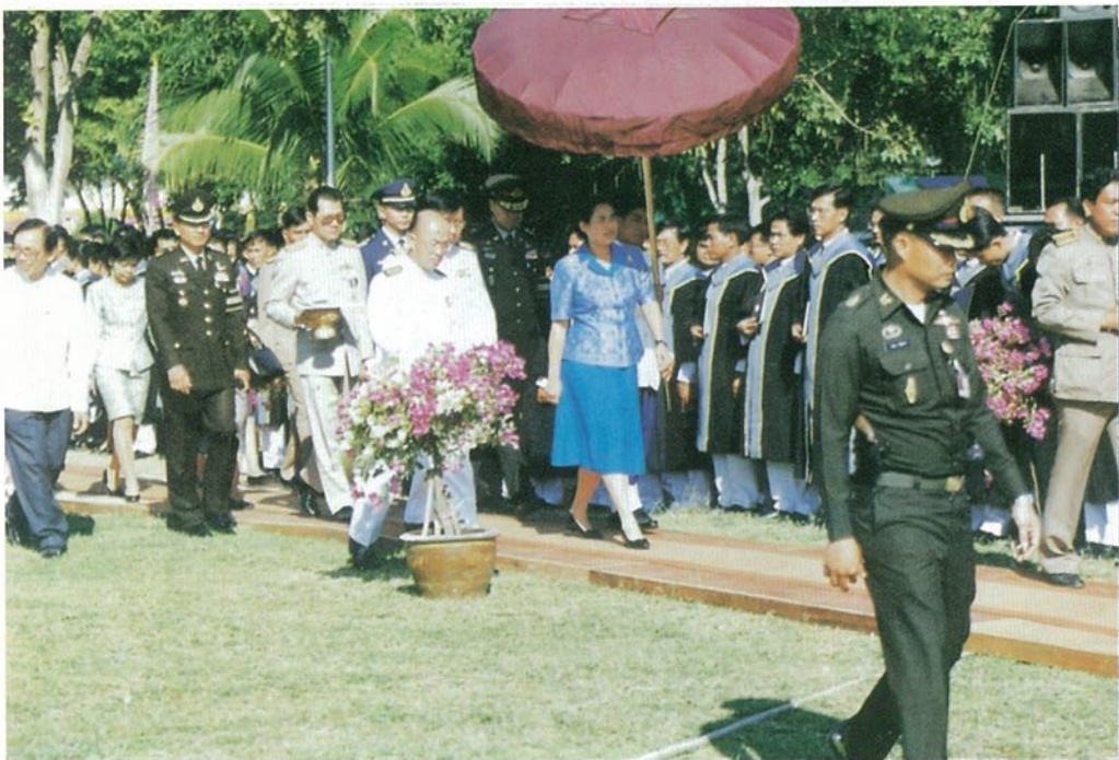
สมเด็จพระเทพรัตนราชสุดาฯ สยามบรมราชกุมารี เสด็จพระราชทานปริญญาบัตร ณ มหาวิทยาลัยมหาสารคาม