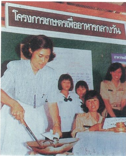
เพ็ญพระราชกรณียกิจ