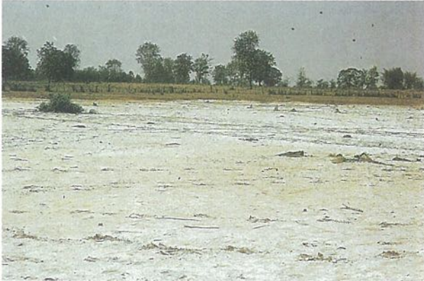
(๑) พื้นที่ดินเค็มจัด