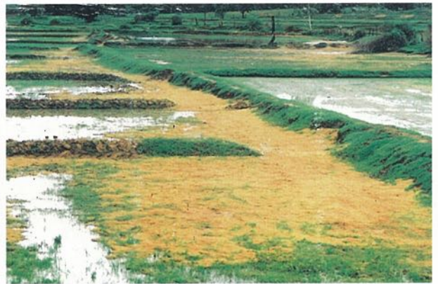
(๔) การปรับปรุงดินเค็มด้วยแกลบ