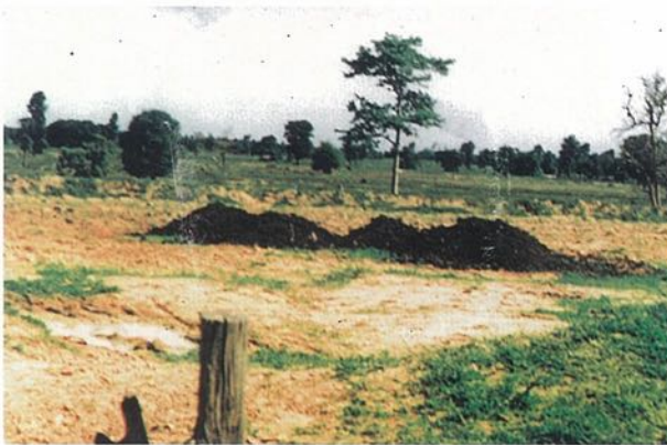
(๓) การใส่ปุ๋ยหมักปรับปรุงดินเค็ม