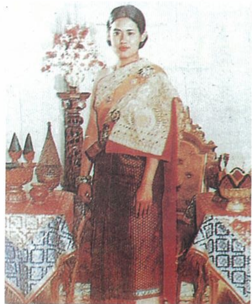
สถิตเสถียรคุณากร