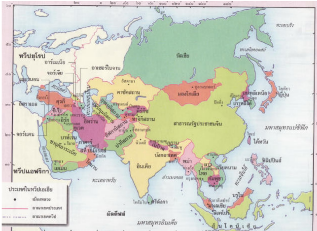
แผนที่ประเทศในทวีปเอเชีย