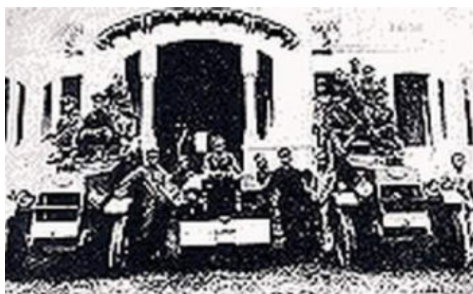
กองกำลังของคณะราษฎรถ่าย ณ บริเวณหน้าวังปารุสกวัน

รัฐธรรมนูญที่คณะราษฎรได้นำขึ้นทูลเกล้าฯ ถวายเพื่อทรงลงพระปรมาภิไธยมี 2 ฉบับ คือ พระราชบัญญัติธรรมนูญการปกครองแผ่นดินสยามชั่วคราว พ.ศ. 2475 และรัฐธรรมนูญแห่งราชอาณาจักรสยาม พ.ศ. 2475