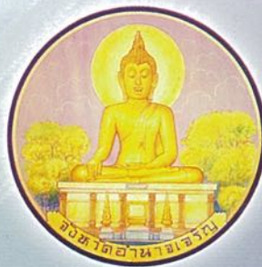
ตราประจำจังหวัด