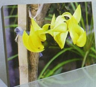
ดอกไม้ประจำจังหวัด ดอกจานเหลือง

ประกอบด้วย พระมงคลมิ่งเมืองเป็นประธานของภาพ แสงฉัพพรรณรังสีเปล่งรัศมีแผ่ โดยรอบพระเศียร ช้ายขวา มีต้นไม้อยู่ ๒ ช้าง ถัดไปเป็นกลุ่มเมฆ ด้านล่าง แถบป้ายบอกชื่อจังหวัดอำนาจเจริญ ความหมาย พระมงคลมิ่งเมืองเป็นพระพุทธรูปขนาดใหญ่ ตั้งอยู่กลางแจ้งในบริเวณพุทธอุทยาน พระมงคลมิ่งเมือง ประดับด้วยโมเสกสีทองเหลืองอร่ามเป็นศรีสง่าของเมือง เป็นศูนย์รวมจิตใจของชาวเมือง รัศมีสว่างแผ่กระจายรอบพระเศียร หมายถึง พุทธานุภาพแห่งพระมงคลมิ่งเมืองที่แผ่กระจายครอบคลุมทั่วจังหวัดอำนาจเจริญ ให้ชาวจังหวัดอำนาจเจริญประสบแต่ความสุขและความเจริญรุ่งเรือง