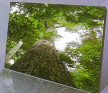
ต้นไม้ประจำจังหวัด ต้นตะเคียนหิน