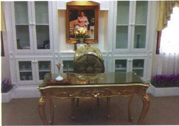
ห้องเฉลิมพระเกียรติ