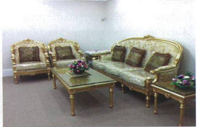
ห้องภูมิปัญญา