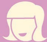
ประสบการณ์ของ คุณแม่ใน จ.สุรินทร์