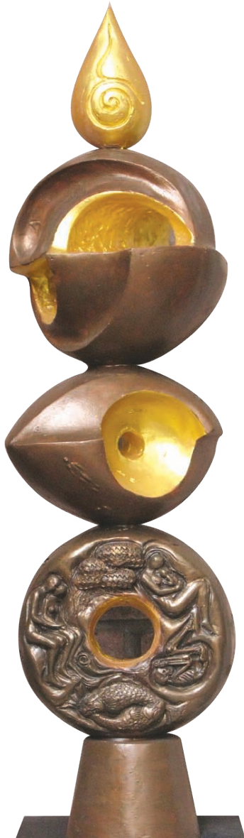
ศิลปิน: มานพ สุวรรณปิณฑะ