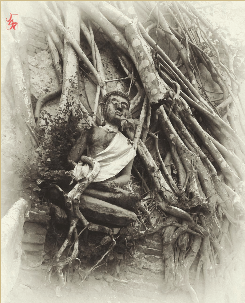
ศิลปิน: จักรพงษ์ วงษ์มัย