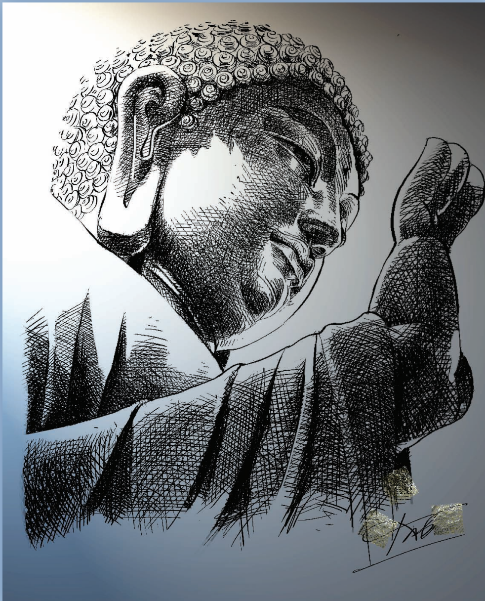
ศิลปิน: ประเสริฐ สุขไย