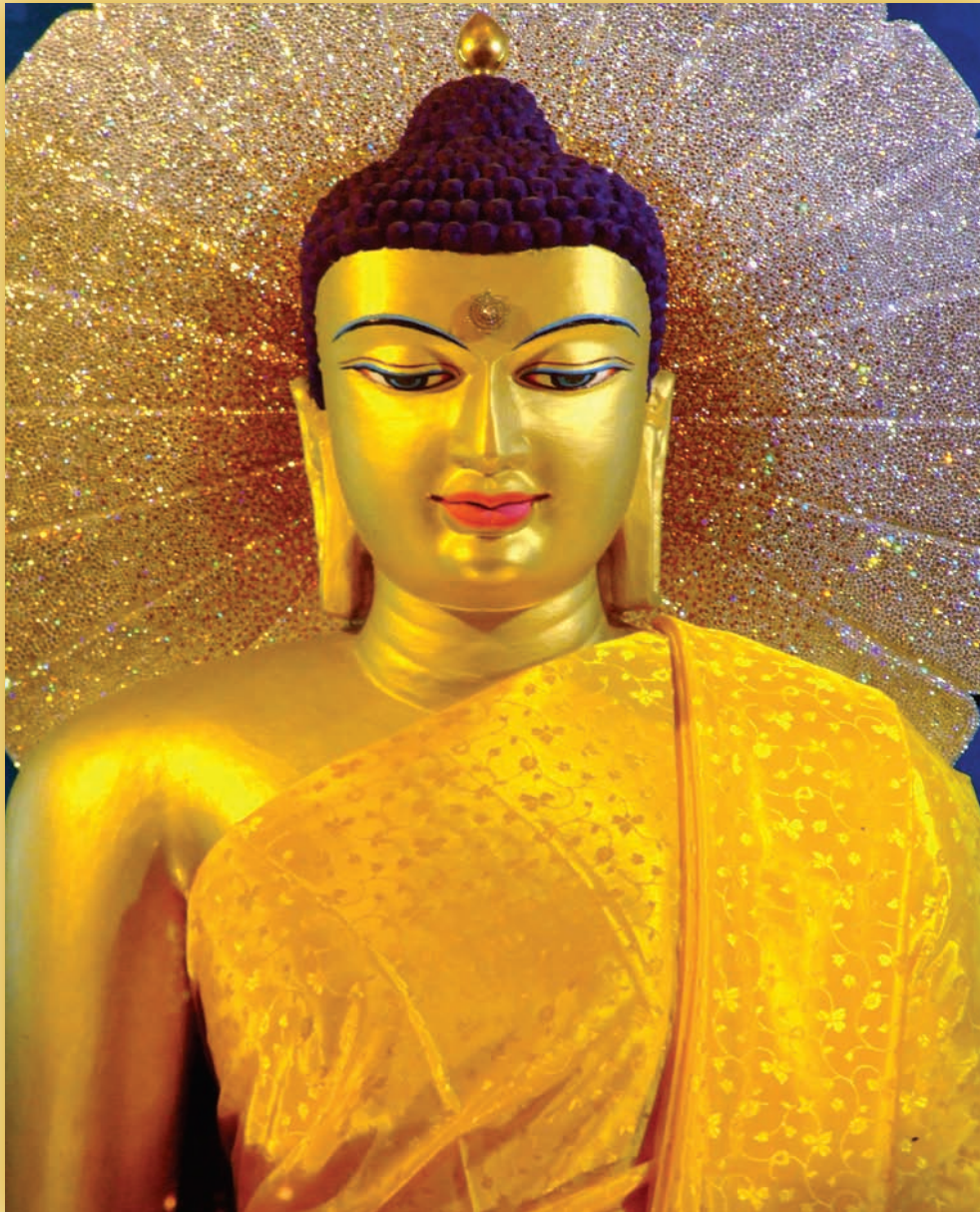
ศิลปิน: ฌานชลกฤต วัฒนาร