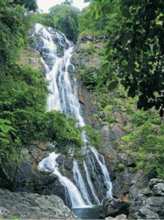
น้ำตกสาริกา

ผู้ใหญ่ 40 บาท เด็ก 20 บาท ชาวต่างชาติ ผู้ใหญ่ 200 บาท เด็ก 100 บาท