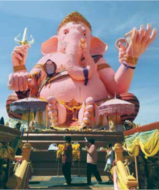
อุทยานพระพิฆเนศ

อ่างเก็บน้ำขึ้นไป 2 กิโลเมตร มี “น้ำตกทรายทอง” ที่มีน้ำเกือบตลอดปี การเดินทางไปยังน้ำตกทรายทอง ต้องเดินจากตัวเขื่อนเข้าไป ใช้เวลา 30 นาที