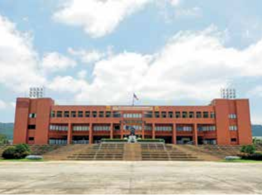
โรงเรียนนายร้อยพระจุลจอมเกล้า