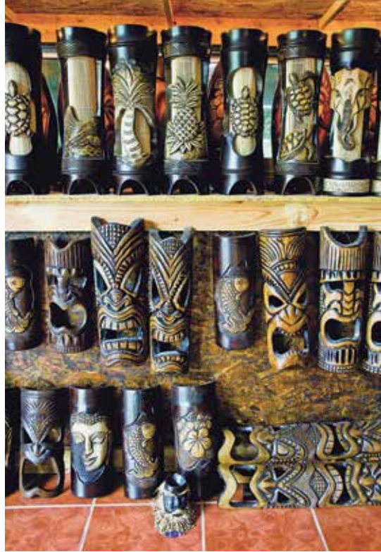
ผลิตภัณฑ์จากไม้ไผ่และไม้มะม่วง

ร้านแปลก 20/1 หมู่ที่ 3 ตำบลหินตั้ง โทร. 0 3738