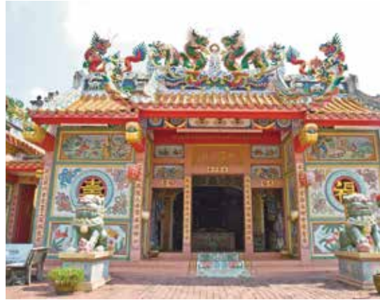
ศาลเจ้าพ่อองครักษ์

การเดินทาง จากถนนรังสิต-นครนายก เลี้ยวขวาเข้าอำเภอองครักษ์ และเลี้ยวซ้ายเข้าทางไปโรงพยาบาลองครักษ์ ถึงโรงพยาบาลองครักษ์เลี้ยวขวาไปอีก 600 เมตร จากนั้นเลี้ยวซ้ายข้ามแม่น้ำนครนายกก็จะถึงศาล