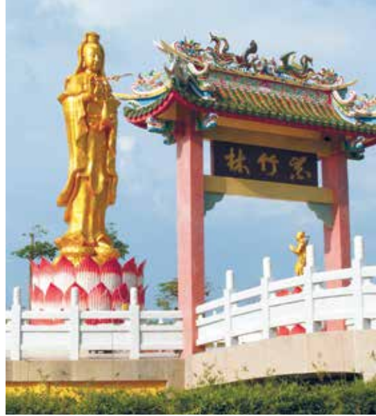
เจ้าแม่กวนอิม ณ พุทธสถานจิตต์กัลป์

น้ำตกกะอาง ตั้งอยู่ที่ตำบลศรีกะอาง จากตัวเมืองไปตามถนนสุวรรณศร ถึงอำเภอบ้านนา เยื้องกับสถานีตำรวจภูธรบ้านนา มีถนนแยกไปน้ำตกกะอาง ระยะทาง 11 กิโลเมตร เป็นน้ำตกขนาดเล็กที่ไหลผ่านลานหินกว้าง ช่วงเวลาที่เหมาะสมกับการท่องเที่ยว คือช่วงฤดูฝน บริเวณใกล้เคียงมีสถานีเพาะชำกล้าไม้ของกรมป่าไม้ บนเนินเขาเป็นที่ประดิษฐานพระพุทธรูปปางมารวิชัย