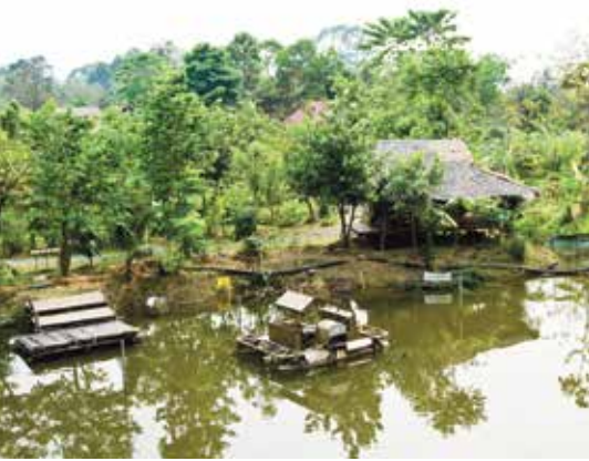
ศูนย์ภูมิรักษ์ธรรมชาติ

พัฒนาตนเองตามแนวพระราชดำริ ประกอบด้วย อาคารนิทรรศการต้อนรับนักท่องเที่ยว อาคารประชุม ร้านอาหาร และ Outdoor Theater แปลงสาธิต กิจกรรมกลางแจ้ง แปลงทฤษฎีแก้มลิง แปลงปลูกหญ้าแฝก แปลงทฤษฎีเกษตรแผนใหม่ และจุดสาธิตเรื่องพลังงาน