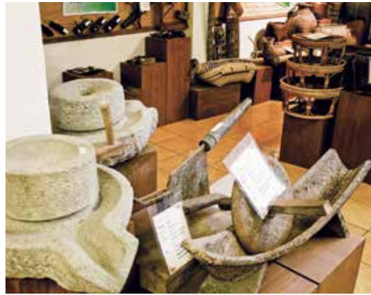
พิพิธภัณฑ์พื้นบ้านไทยพวน

เครื่องมือในการทอผ้า เป็นต้น นอกจากนี้ ภายในบริเวณวัดยังมีกลุ่มทอผ้าพื้นเมือง ลานแสดงวัฒนธรรมการทำไข่เค็มสูตรใบเตยหอม เปิดให้เข้าชมทุกวัน ตั้งแต่เวลา 09.00-17.00 น. การเข้าชมเป็นหมู่คณะ และชมการแสดงทางวัฒนธรรมพื้นบ้านไทยพวน ต้องแจ้งล่วงหน้า สอบถามรายละเอียดเพิ่มเติมได้ที่ โทร. 0 3739 9833, 08 1458 8200