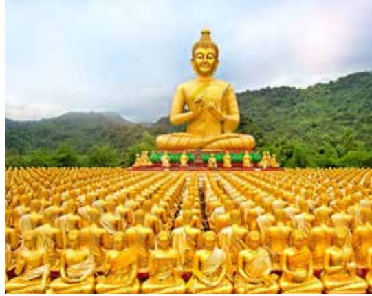
พุทธอุทยานมาฆบูชาอนุสรณ์ สวนพุทธชยันตี 2600 ปี

อุทยานวังตะไคร้ ตั้งอยู่ที่ตำบลหินตั้ง ห่างจาก