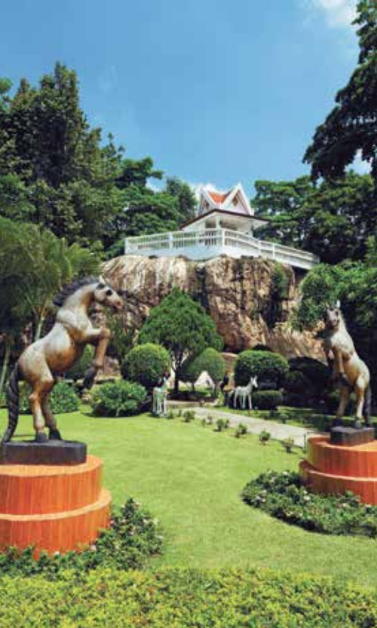
ศาลเจ้าพ่อขุนด่าน

พระพุทธรูป เป็นภาพเขียนสีบนหน้าผา ซึ่งอยู่ถัดจากเขาชะงอก มีวิหารครอบไว้ เล่ากันว่าสภาพเดิมเป็นภาพพระพุทธรูปเลือนราง เมื่อ พ.ศ. 2485 กรมแผนที่ทหารบกเข้าไปตั้งโรงงานหินอ่อนที่เชิงเขา จึงได้เขียนสีตามรอยพระพุทธรูปเดิมให้ชัดเจนขึ้น ในช่วงกลางเดือน 3 จะมีงานนมัสการเป็นประจำทุกปี หากเดินไปทางด้านหลังวัดพระฉายจะพบ “น้ำตกพระฉาย” เป็นน้ำตกจากหน้าผาสูง 30 เมตร ลงสู่แอ่งน้ำเบื้องล่างซึ่งสามารถเล่นน้ำได้