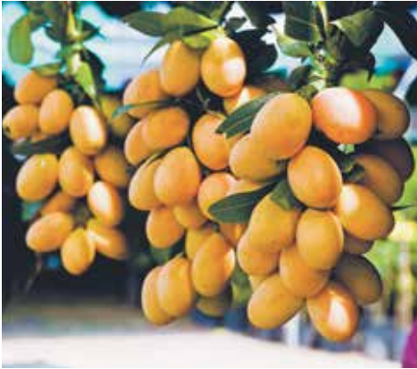
งานมะยงชิด - มะปร่างหวานและของดีนครนายก

งานไม้ดอกไม้ประดับและของดีองครักษ์ จัดในเดือนกุมภาพันธ์ของทุกปี บริเวณหมู่บ้านไม้ดอกไม้ประดับ คลอง 15 ตำบลบางปลากรด อำเภอองครักษ์ ภายในงานมีการประกวดไม้ดอกไม้ประดับ และประกวดการจัดสวนหย่อม