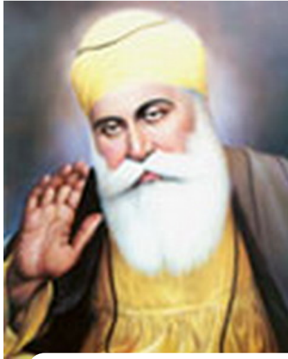
คุรุนานัก