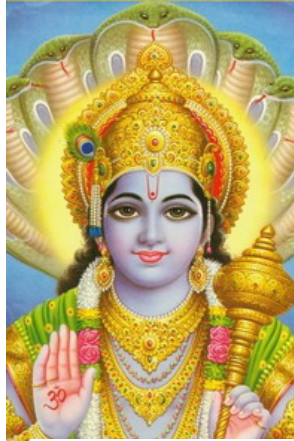
พระวิษณุ