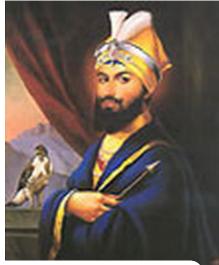
คุรุโกวินทสิงห์