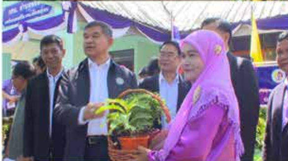
พลเอก สุรเชษฐ์ ชัยวงศ์ รัฐมนตรีช่วยว่าการกระทรวงศึกษาธิการ พร้อมคณะ เปิดศูนย์เรียนรู้เศรษฐกิจพอเพียงและเกษตรทฤษฎีใหม่ ประจำตำบลพร่อน นำร่องการขับเคลื่อนที่โรงเรียนมุสลิมศึกษา ตำบลพร่อน อ.เมือง จ.ยะลา เมื่อวันที่ 11 พฤษภาคม 2559