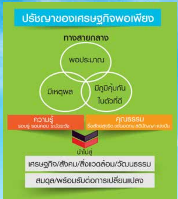
สรุปหลักปรัชญาของเศรษฐกิจพอเพียง

ความพอประมาณสามารถเริ่มได้จากการใช้ทรัพยากรที่มีอยู่เดิมของตนเอง ชุมชนท้องถิ่น ให้เกิดประโยชน์สูงสุดก่อนที่จะแสวงหาแหล่งทุน วัตถุดิบ สิ่งของหรือการบริการจากภายนอก และวางแผนการใช้้อย่างเหมาะสมกับสภาวะเศรษฐกิจ สังคมและสิ่งแวดล้อม ไม่มากเกินไปจนเสียสุขภาพและไม่น้อยจนขาดแคลน แต่เป็นการใช้อย่างรู้คุณค่า ดูแลรักษาสิ่งที่มีและพัฒนาต่อยอดให้ดียิ่งขึ้น เน้นการส่งเสริมให้เกิดความเข้มแข็งจากภายในที่เรียกว่า “ระเบิดจากข้างใน” แล้วขยายเชื่อมโยงกับภายนอกเพื่อให้เกิดความเข้มแข็งอย่างยั่งยืน โดยอาศัยความรู้ รอบคอบในการคิด วางแผน และตัดสินใจที่อยู่บนพื้นฐานของคุณธรรมตั้งมั่นอยู่บนความซื่อสัตย์ สุจริต