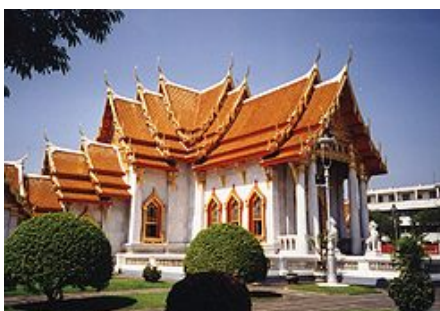
วัดเบญจมบพิตรดุสิตวนาราม