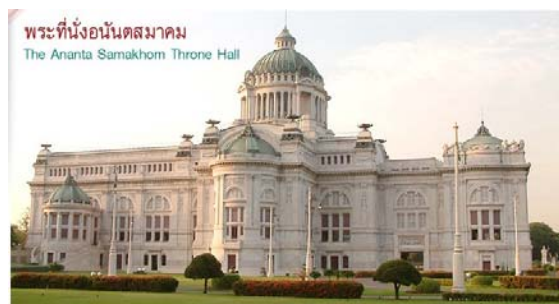
พระที่นั่งอนันตสมาคม