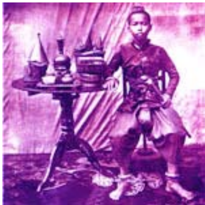
พระราชพิธีบรมราชาภิเษก ครั้งที่ 1

เมื่อพระองค์ทรงมีพระชนมายุครบ 20 พรรษา จึงทรงลาผนวชเป็นพระภิกษุ และได้มีการจัดพระราชพิธีบรมราชาภิเษกครั้งที่สอง เมื่อวันที่ 15 พฤศจิกายน พ.ศ. 2416 โดยได้รับการเฉลิมพระปรมาภิไธยว่า พระบาทสมเด็จพระปรมินทรมหาจุฬาลงกรณ์ฯ พระจุลจอมเกล้าเจ้าอยู่หัว