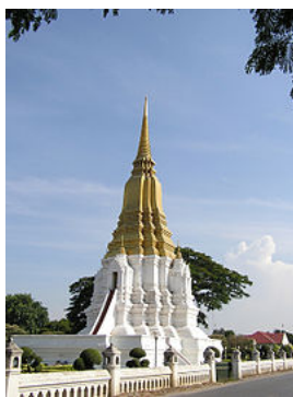
เจดีย์พระสุริโยทัย บรรจุพระบรมอัฐิสมเด็จพระสุริโยทัย