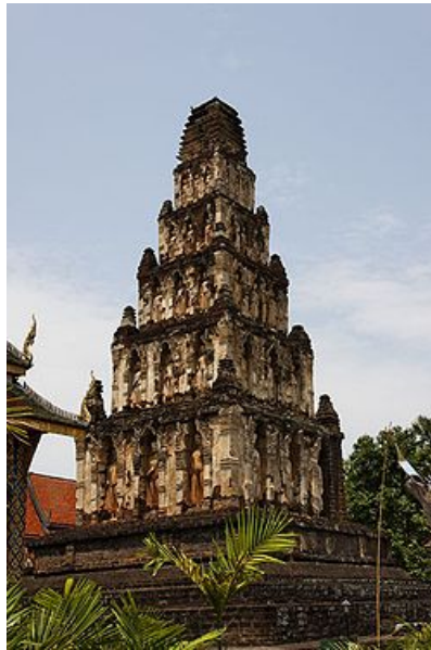
สุวรรณจังโกฏิเจดีย์