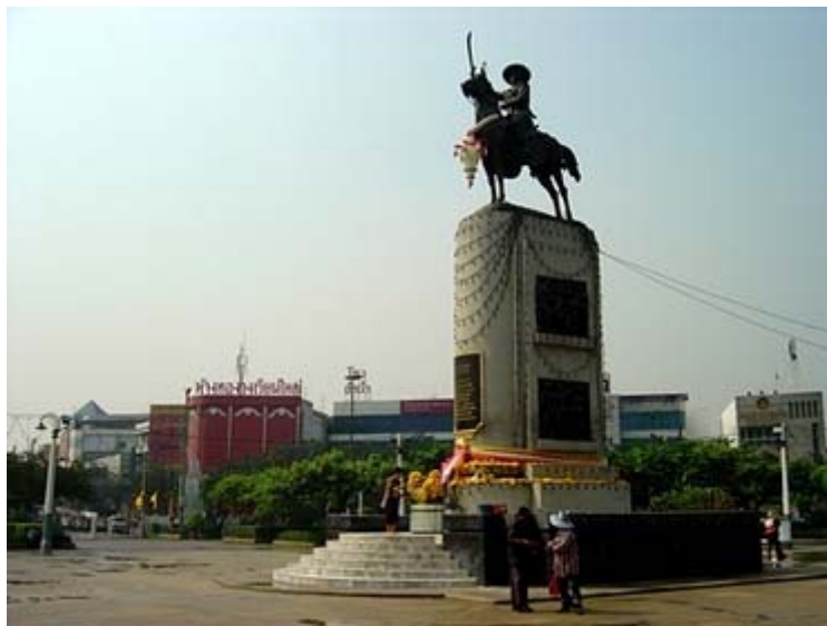
อนุสาวรีย์วงเวียนใหญ่ กรุงเทพมหานคร

สำหรับพระยาวชิรปราการได้จัดเตรียมกองทัพ สะสมเสบียงอาหาร ศาตราวุธ และกองทัพเรือ อยู่เป็นเวลา 3 เดือน ก็ยกกองทัพเรือเข้ามาทางปากน้ำเจ้าพระยา ตีเมืองธนบุรีแตกจับนายทองอิน ประหาร แล้วเลยไปตีค่ายโพธิ์สามต้นจนแตกยับเยิน สู้กับพระนายกองตายในที่รบ ชับไล่พม่าออกไปพ้น แผ่นดินไทยสำเร็จในปี พ.ศ. 2310 ซึ่งใช้เวลากู้อิสรภาพกลับคืนจากพม่า ภายในเวลาเพียง 7 เดือน จากนั้น พระยาวชิรปราการจึงยกทัพกลับมากรุงธนบุรีและปราบดาภิเษกเป็นพระมหากษัตริย์ ทรง พระนามว่า สมเด็จพระบรมราชาที่ 4 แต่ประชาชนนิยมเรียกพระนามว่า พระเจ้าตากสิน เมื่อวันที่ 28 ธันวาคม พ.ศ. 2311 และสถาปนากรุงธนบุรีเป็นราชธานีด้วย จากนั้นพระเจ้าตากสินยกกองทัพไป ปราบปรามก๊กต่างๆ จนราบคาบ ทรงใช้เวลารวบรวมอาณาเขตอยู่ 3 ปี คือตั้งแต่ พ.ศ. 2311- พ.ศ. 2313 จึงได้อาณาเขตกลับคืนมา รวมเป็นราชอาณาจักรเดียวกัน สมเด็จพระเจ้าตากสินสวรรคต เมื่อวันที่ 6 เมษายน 2325 สิริพระชนมายุได้ 48 พรรษา ทรงครองราชย์เป็นเวลา 15 ปี สมเด็จพระเจ้าตากสิน ทรงมี พระราชโอรสและพระราชธิดากับสมเด็จพระอัครมเหสี กรมหลวงบาทบริจา และกรมบริจาภักดีศรีสุดา รักษ์ รวมทั้งพระสนมต่าง ๆ รวมทั้งสิ้น 29 พระองค์ ต่อมาพระราชราชมารดาผู้สํานักในพระมหากษัตริย์คุณ จึงยกย่องถวายพระเกียรติพระองค์ท่านว่า มหาราช คณะรัฐบาล ชำราชากร พ่อค้า ประชาชนทุกหมู่เหล่า ได้พร้อมใจกันสร้างอนุสาวรีย์เพื่อน้อมรำลึกในพระเกียรติประวัติ เกียรติยศ เกียรติคุณ ให้ปรากฏกับ อนุชนตราบเท่าทุกวันนี้