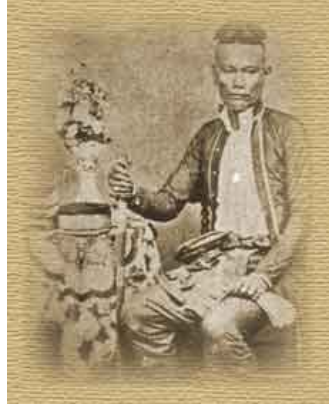
ผมทรงมหาดไทย