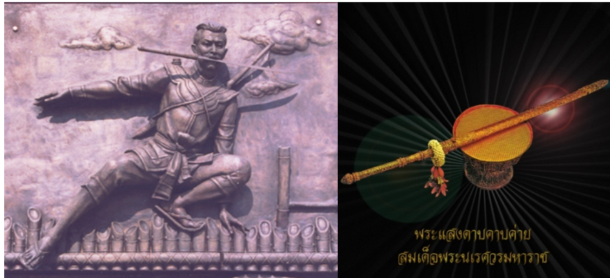
พระแสงดาบคาบค่าย