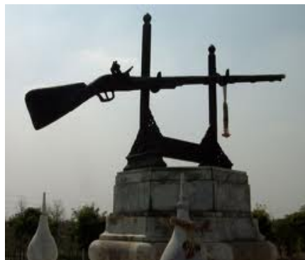
พระแสงปืนต้นข้ามแม่น้ำสะโตง

ขณะเดินทัพไปยังหงสาวดี พระนเรศวรก็ได้ข่าวว่า พระเจ้าหงสาวดีนั้นทบุเรงได้ช่วยชนะเมืองตองอู และกำลังจะเสด็จกลับหงสาวดี จึงทรงระงับแผนเข้าตีหงสาวดี เพียงแต่นำครอบครัวคนไทยที่ถูกกวาดต้อนไปอยู่ที่นั่นกลับกรุงศรีอยุธยา ขณะที่ข้ามแม่น้ำสะโตงมาได้นั้น กองทัพพม่าที่ไล่ติดตามมาทัน เกิดยิงต่อสู้กันคนละฝั่งแม่น้ำ แต่แม่น้ำกว้างมาก กระสุนปืนธรรมดาไปไม่ถึง พระนเรศวรทรงใช้ปืนยาว 9 คืบ ยิงได้ไกลและแม่นยำ ยิ่งถูกแม่ทัพพม่าตายคาคอช้าง พม่าจึงเลิกติดตาม พระแสงปืนนี้มีนามปรากฏว่า พระแสงปืนต้นข้ามแม่น้ำสะโตง นับเป็นเครื่องราชูปโภคของพระมหากษัตริย์ไทยตราบเท่าทุกวันนี้