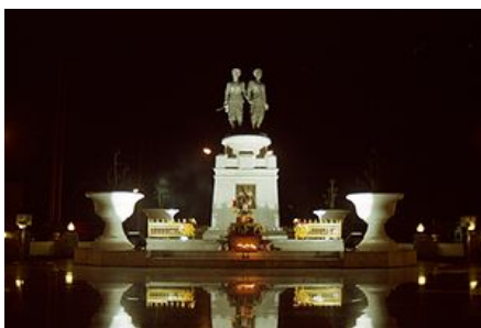
อนุสาวรีย์ท้าวเทพกระษัตรี ท้าวศรีสุนทร