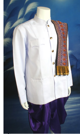
เสื้อราชปะแตนนุ่งผ้าม่วง