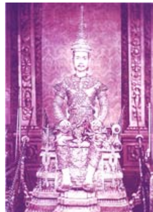
พระราชพิธีบรมราชาภิเษก ครั้งที่ 2