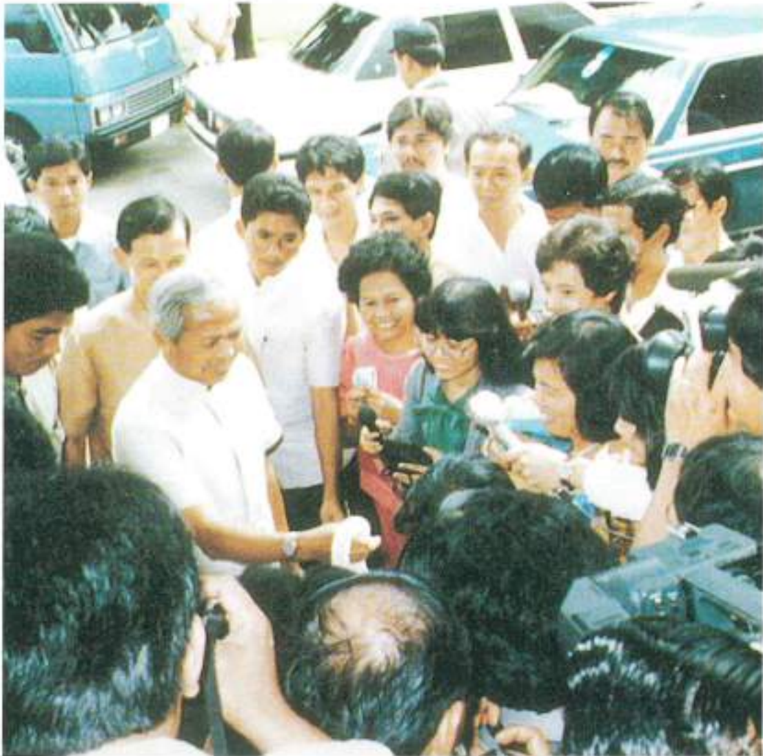
ผู้สื่อข่าวสายการเมืองมอบดอกไม้เนื่องในวันคล้ายวันเกิด

“...ผมภูมิใจอย่างยิ่งที่ผมเกิดมาเป็นทหารเหมือนกับนายทหาร และนายตำรวจทั้งหลาย