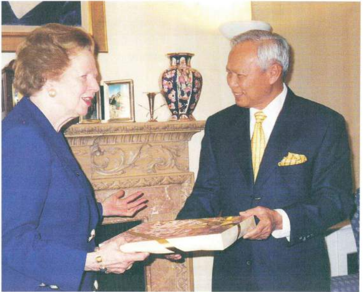
ระธานกิตติมศักดิ์มูลนิธิรัฐบุรุษ ได้เข้าเยี่ยม ฯพณฯ มากาเร็ต แธทเชอร์ อดีตนายกรัฐมนตรี สหราชอาณาจักร มีความสัมพันธ์อันดี ที่กรุงลอนดอน และเจรจาการประสานงาน ระหว่างมูลนิธิรัฐบุรุษ ในกิจการต่างประเทศ ละส่งเสริมผู้นำทางสังคม ด้านวิเทศสัมพันธ์