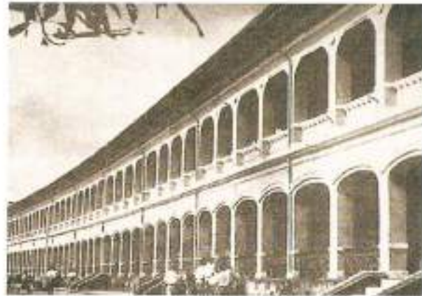
โรงเรียนสวนกุหลาบวิทยาลัย พ.ศ. ๒๔๙๐

แบบอย่างของชีวิต นับว่ามีความจำเป็น เด็กและเยาวชนที่เติบโตมา แม้ว่าโดยธรรมชาติแล้ว ความเป็นอิสระและความหลากหลายจะเป็นสิ่งสำคัญของชีวิตก็ตาม แต่ในขั้นต้น แบบอย่างของชีวิตที่ดีงามก็สมควรให้เด็กได้ยึดถือบ้างเช่นกัน