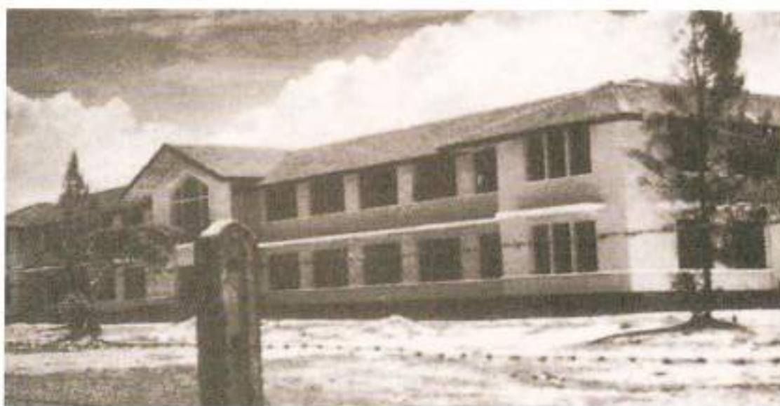
โรงเรียนมหาวิทยาลัยราชภัฏ โรงเรียนแห่งแรกในชีวิต แหล่งที่ประสิทธิ์ประสาทวิชาการ

ชีวิตอันเป็นแบบอย่าง ที่มาแห่งอุดมการณ์ “เกิดมาต้องตอบแทนบุญคุณแผ่นดิน”