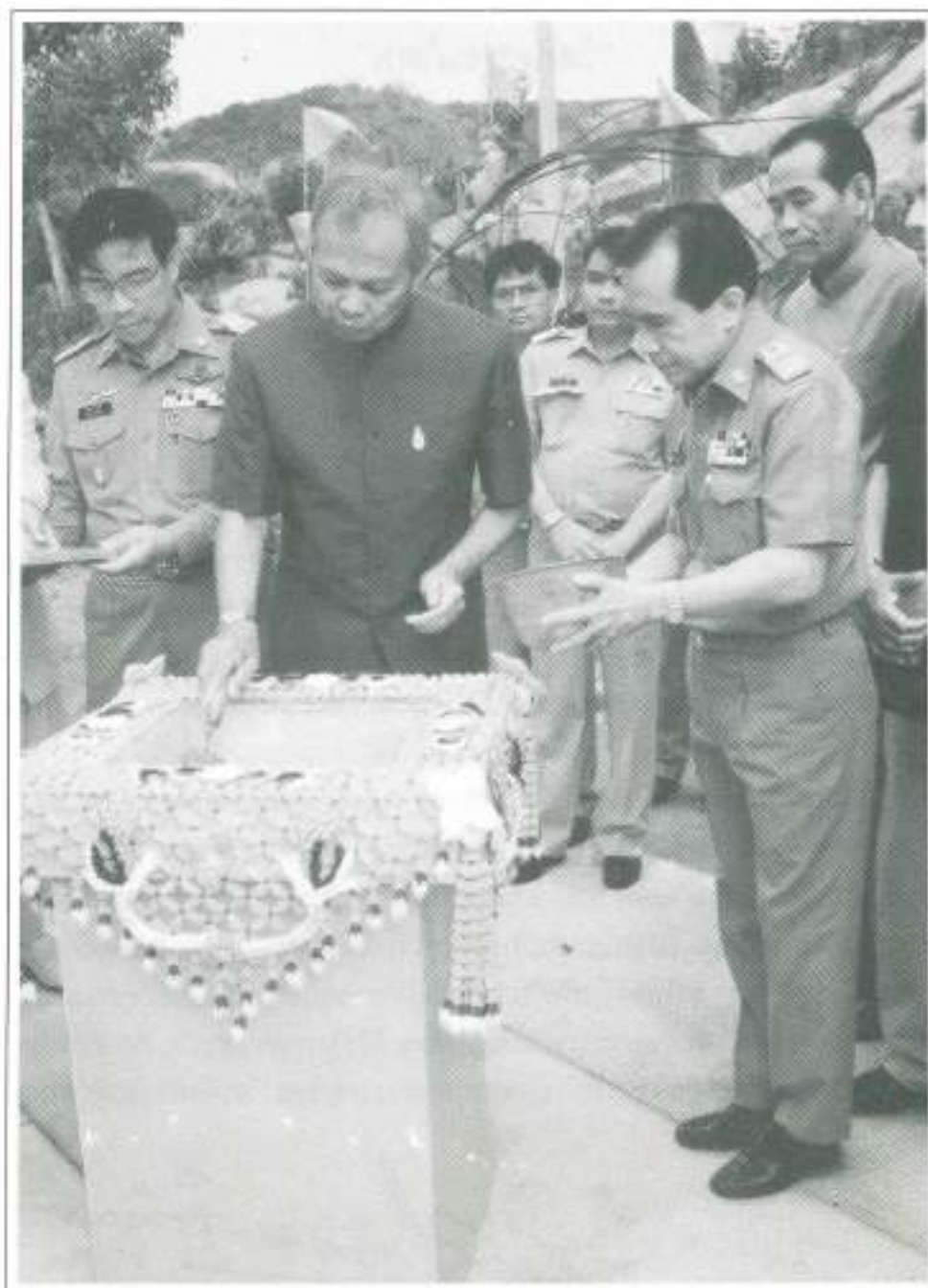
ฯพณฯ พลเอก เปรม ติณสูลานนท์ องคมนตรีและรัฐบุรุษ ประธานกิตติมศักดิ์มูลนิธิฯ เป็นประธานในพิธีวางศิลาฤกษ์อาคารหอสมุดแห่งชาติกาญจนาภิเษก สงขลา วันพุธที่ 12 เมษายน 2538