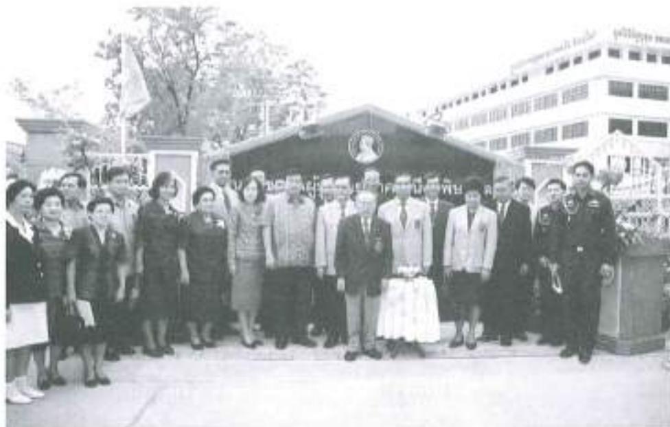
พิธีเปิด “ศูนย์สุขภาพผู้สูงอายุภาคเหนือ พิษณุโลก” ที่โรงพยาบาลพุทธชินราช พิษณุโลก วันที่ ๙ สิงหาคม ๒๕๔๘