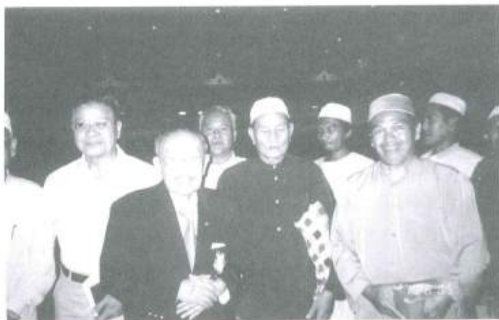
การแสดงปาฐกถาพิเศษ “พลังใจ พลังชาติ” ในโครงการ “सानใจไทย สู้ใจใต้” ที่สงขลา และปัตตานี เมื่อวันที่ ๒๖ กรกฎาคม ๒๕๔๘