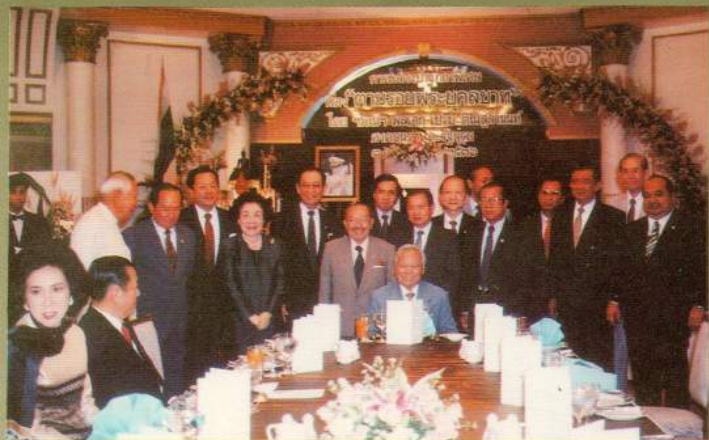
ฯพณฯ พลเอกเปรม ติณสูลานนท์ ประธานกรรมการกิตติมศักดิ์ พร้อมด้วย คณะกรรมการอำนวยการมูลนิธิ รัฐบุรุษ พลเอกเปรม ติณสูลานนท์